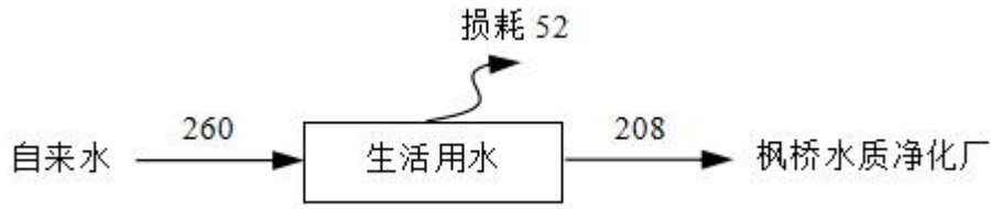
图 5-2 全厂水平衡图 (t/a)