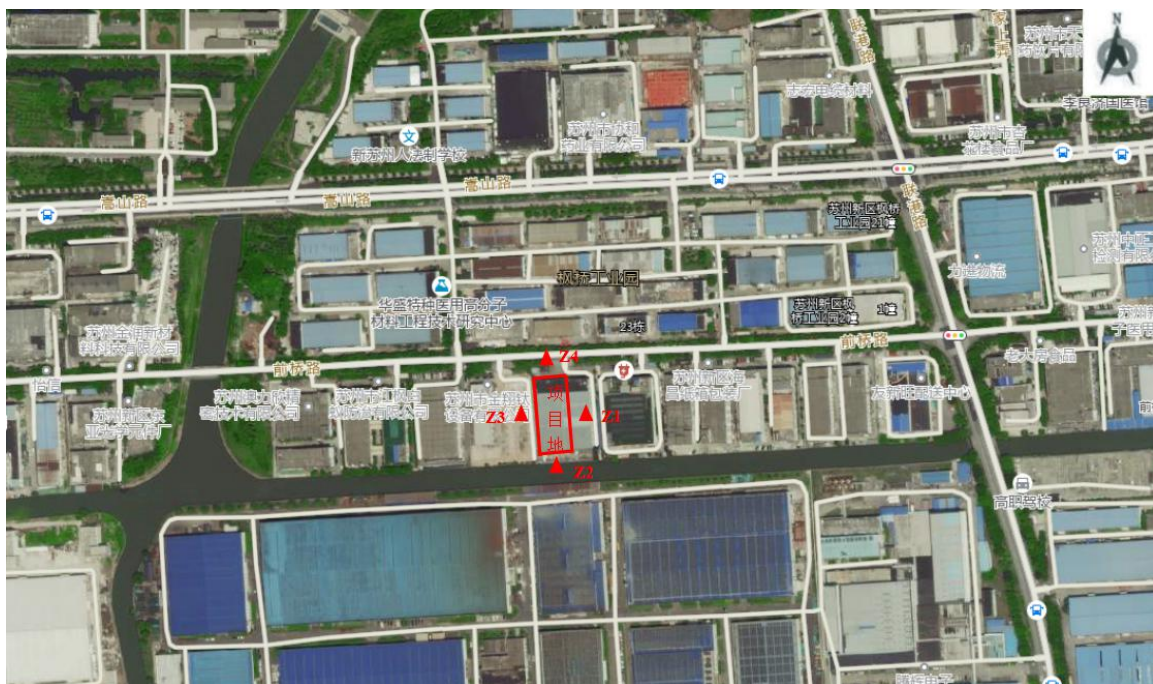
图3-1 声环境质量现状监测点位布置图

根据监测结果可知，本项目所在地厂界昼、夜间声环境质量满足《声环境质量标准》（GB3096-2008）3类标准，说明项目所在区域声环境质量良好。