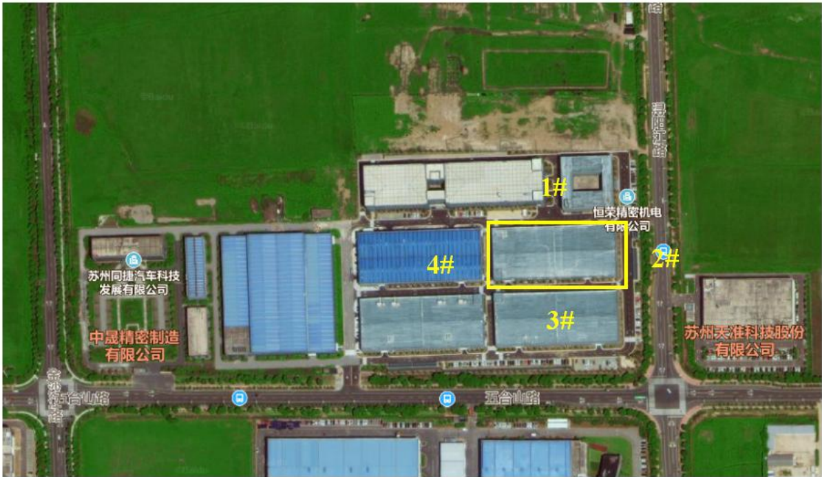
图 3-1 噪声监测点位图

根据监测结果，项目所在地声环境质量可达到《声环境质量标准》（GB3096-2008）3类标准。