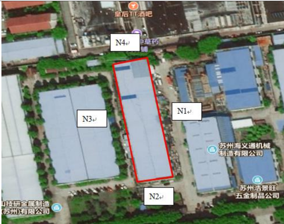
图 3-1 噪声监测点位图