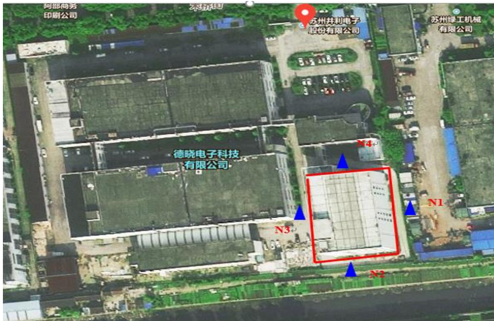
图 3-1 噪声环境质量现状监测位置图