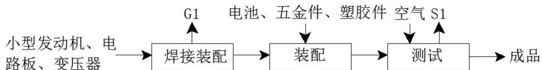
图 5-1 生产工艺流程