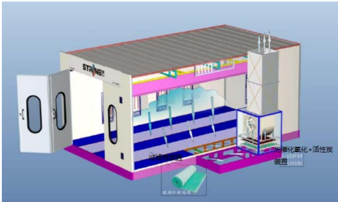
图 5-2 喷漆房废气处理工艺流程示意图